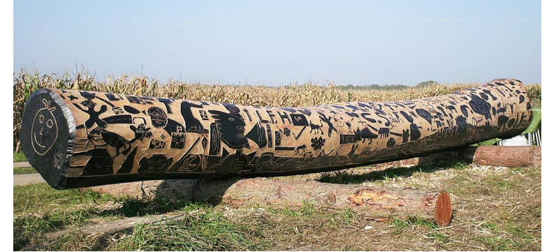
Wolfgang Folmer, in den entrindeten und geschwärzten Baumstamm schnitten Jugendliche Motive. Abschließende Überarbeitung durch den Künstler. Sinnbild für die Bilderflut, die uns durch Medien und Werbung ständig überflutet.