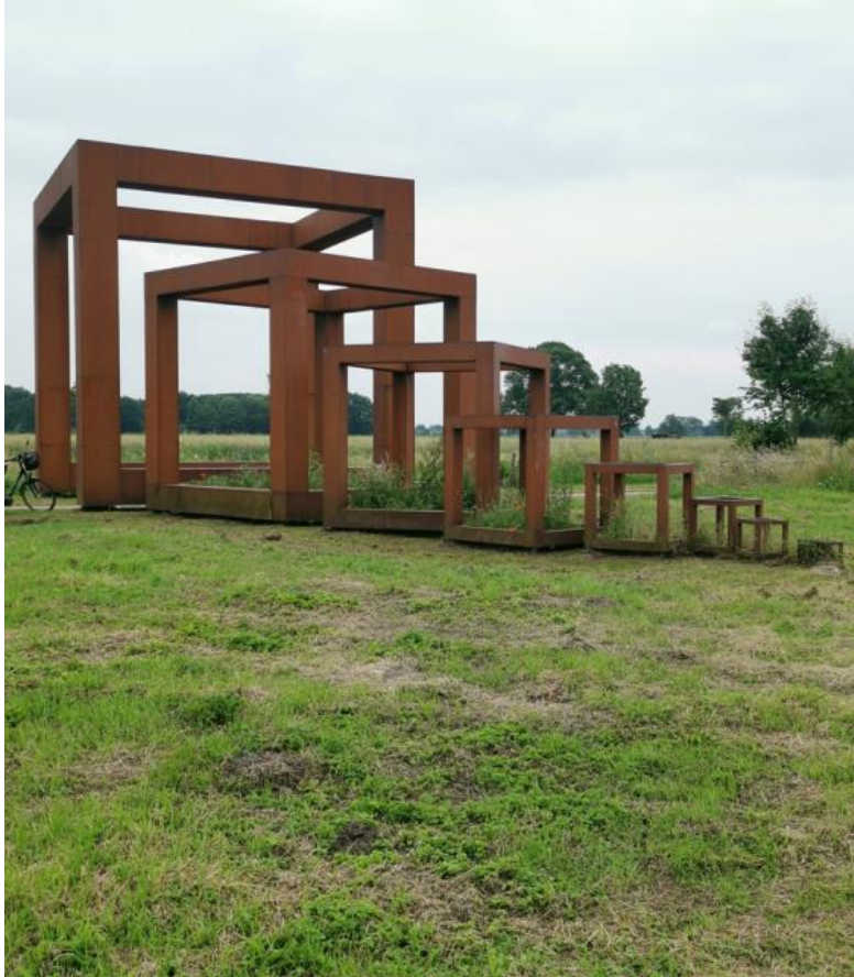
Petra Paffenholz, Sicht auf die Unendlichkeit. Abmessungen nach der Fibonacci-Reihe. Wirken surreal, wie ein Übergang in unkontrollierte Bewusstseinslandschaften.