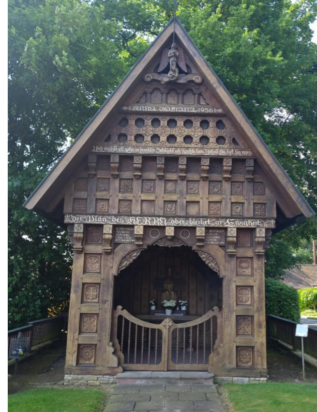
Gedächtniskapelle der Familie Kophanke. Aus Eichenholz geschnitzte Madonna. Zahlreiche Motive: Gesetzestafeln des Moses, Leidenswerkzeuge, Symbole für die Evangelisten und Landwirtschaft. Erzengel Michael am First.