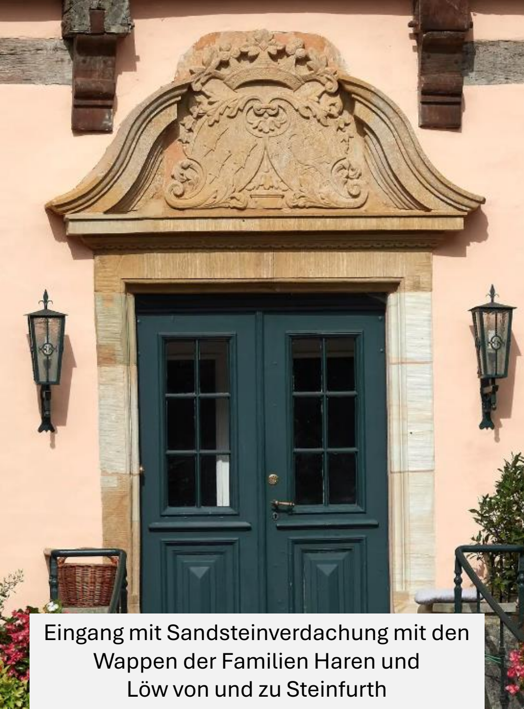
Eingang mit Sandsteinverdachung mit den Wappen der Familien Haren und Löw von und zu Steinfurth