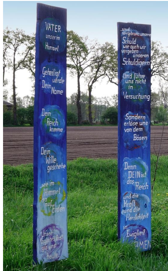
Bali Tollak, Inspiriert durch Totenbretter im Bayrischen Wald entstanden die Seelenbretter. Sie sollen zum Nachdenken anregen