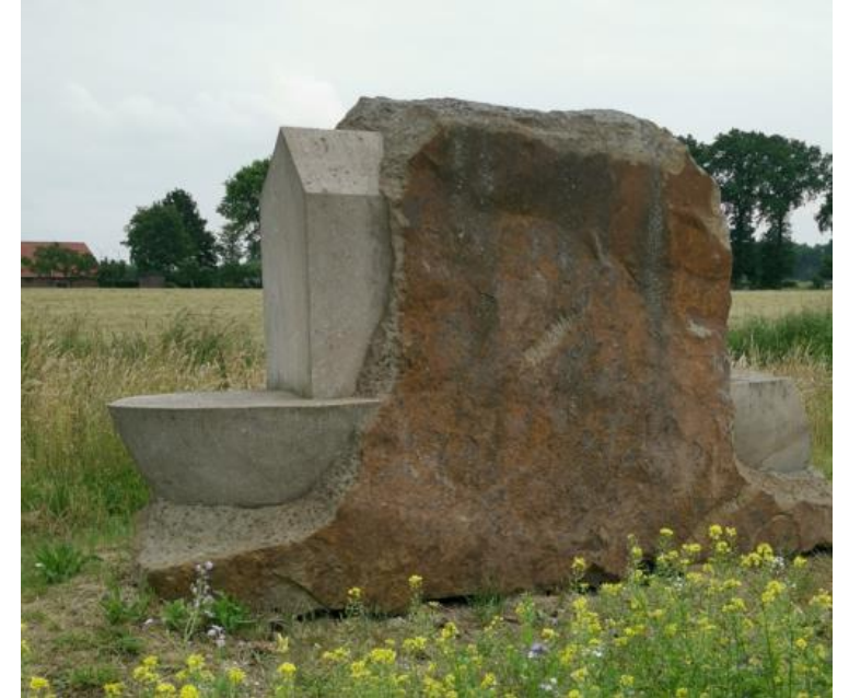
Wolfgang Bröll, Symbol für Bedürfnis nach Schutz und Geborgenheit. Das Fragmentarische bedeutet: Ein Prozess im Werden, den der Betrachter vollenden darf. Material: Ibbenbürener Sandstein