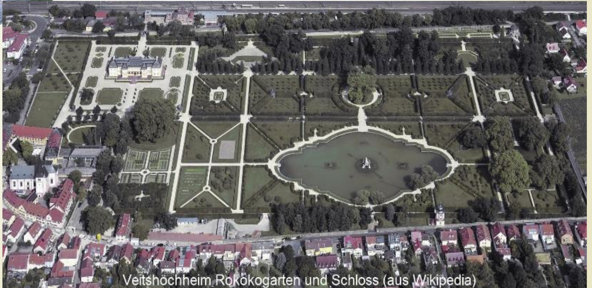
Veitshöchheim Rokokogarten und Schloss