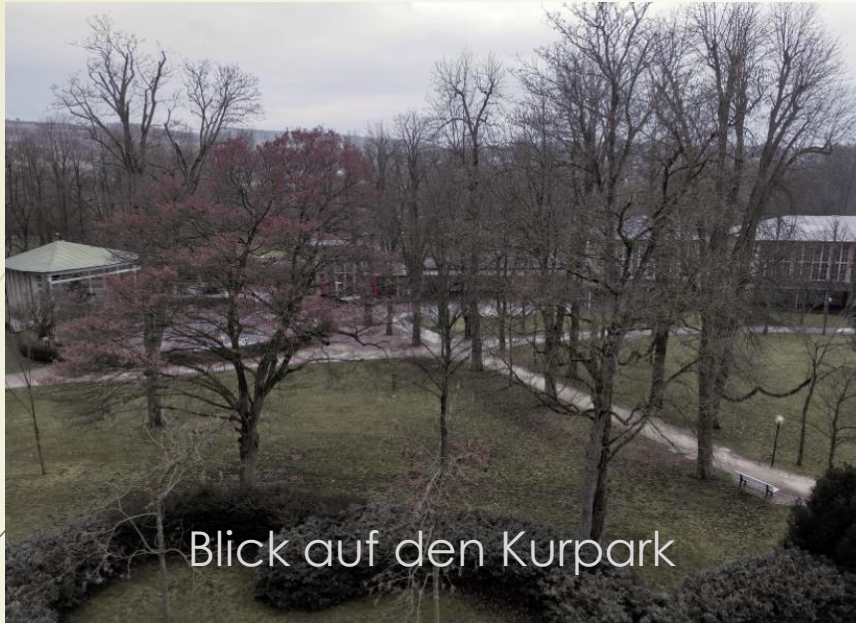
Blick auf den Kurpark