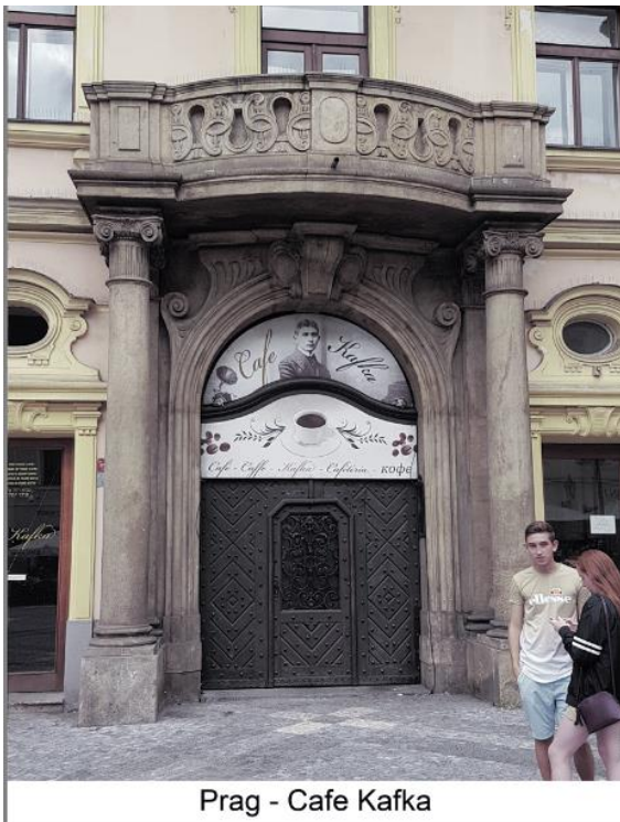
Prag - Cafe Kafka

Erbaut 1876. Neorenaissance. Ursprünglich Bildergalerie, Museum und Konzertsaal, später Sitz der Nationalversammlung. Heute Sitz der Tschechischen Philharmonie mit dem Dvorak-Saal für außerordentliche Konzerte.