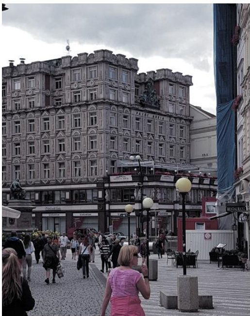
Prag - Adriapalast (Rondokubismus)

Eines der wichtigsten Renaissancehäuser in Prag. Eingangsportal aus 1590 mit Ornamenten und zwei Bären.