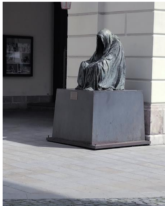
Prag - Mantel des Bewußtseins