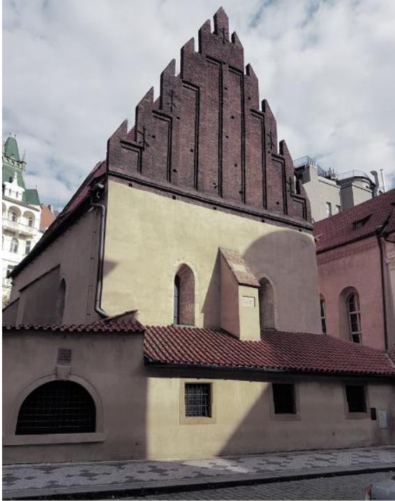
Prag - Hohe Synagoge