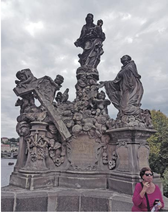
Prag - Karlsbrücke - Madonna und hl Bernhard