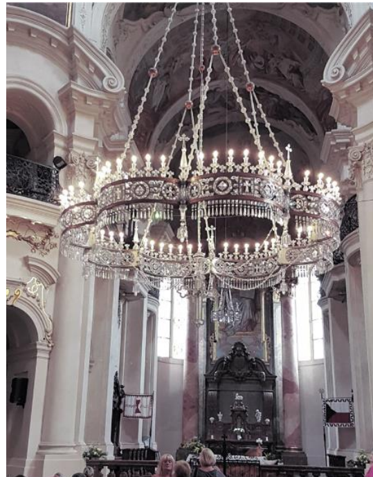
Prag - St. Nikolaus Kirche