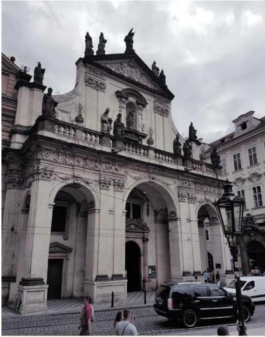
Prag - Salvatorkirche