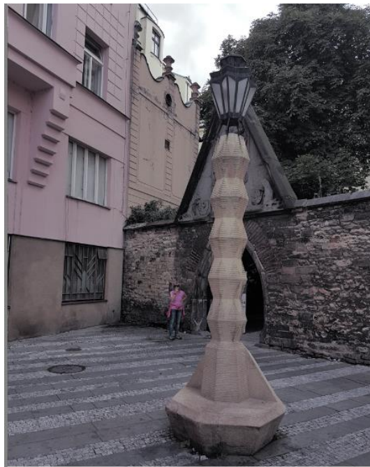
Prag - Kubistische Laterne