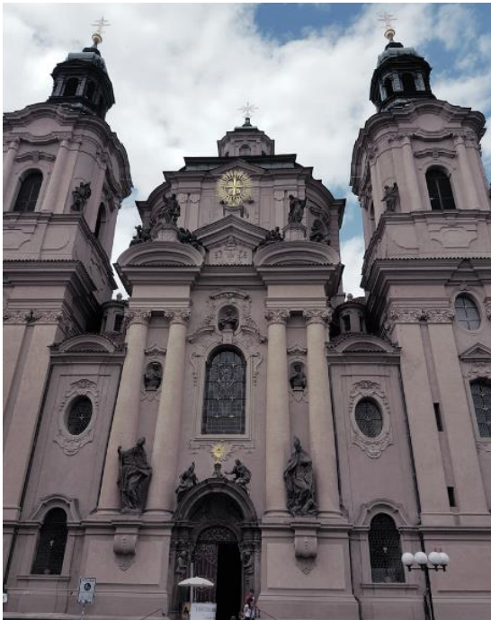
Prag - St. Nikolaus Kirche