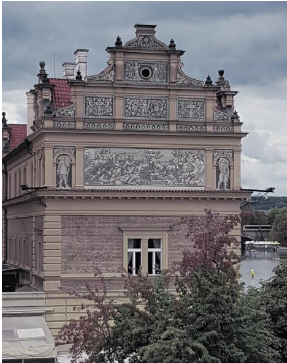
Prag - Bedřich Smetana Museum