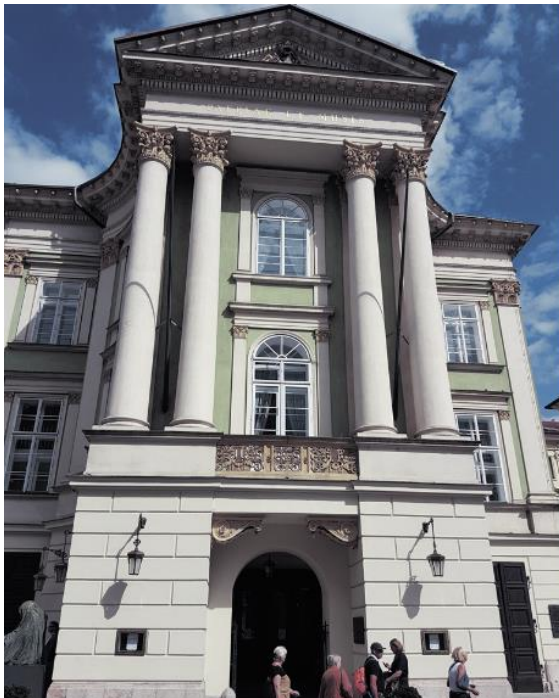
Prag - Ständetheater

Jugendstilbrücke mit vielen Verzierungen und Skulpturen. Bau 1905. Benannt nach dem Dichter Svatopluk Cech. Von dieser Brücke springt in Kafkas Novelle „Das Urteil“ Georg, der von seinem Vater zum Tode durch Ertrinken verurteilt wurde.