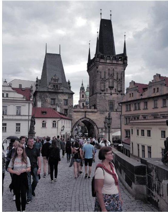
Prag - Kleinseitner Brückenturm