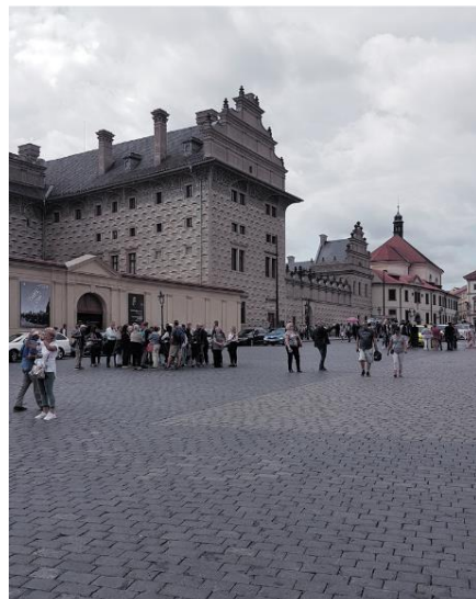
Prag - Schwarzenberg-Palast

Eines der ersten Gebäude in Prag, das in italienischer Renaissance gebaut wurde. Die Wände sind mit schwarzen Sgraffiti bemalt und täuschen Buckelquader vor.