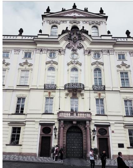
Prag - Erzbischofspalast