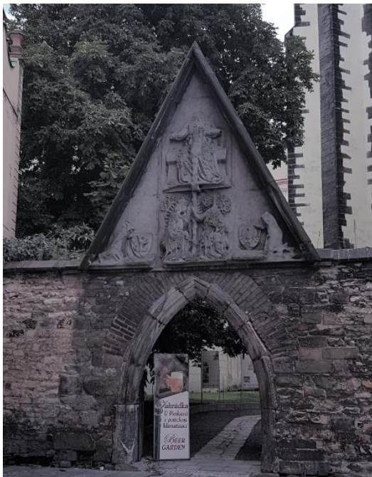
Prag - Portal St. Maria Schnee

Prinz Albert II von Monaco: Rede zur Einweihung der Skulptur im Zentrum von Monaco: "The Cloak of Conscience lädt uns ein nachzudenken, wo wir stehen und über die hintergründige Bedeutung unseres Handelns. ... Er erinnert uns, dass wir die Antworten und die Richtung für unser Leben in unserem tiefsten Inneren finden müssen." Der Prinz schloss mit Worten von Victor Hugo: „Nichts kann das Gewissen des Menschen einengen, denn das Gewissen des Menschen ist der Geist Gottes“.