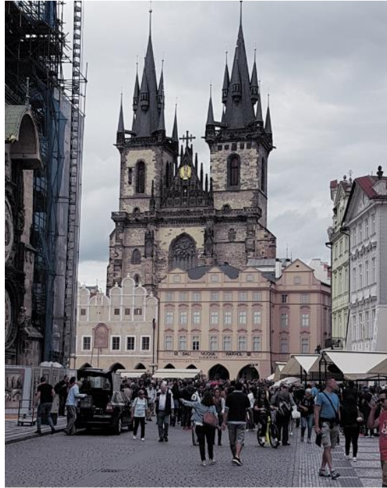
Prag - Teynkirche