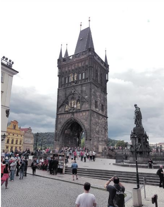
Prag - Altstädter Brückenturm

Ursprünglich eine gotische Kirche, die 1679 durch einen barocken Neubau ersetzt wurde. An der Fassade sind 5 Statuen böhmischer Landespatrone: Agnes, Veit, Franz von Assisi, Wenzel und Ludmilla.