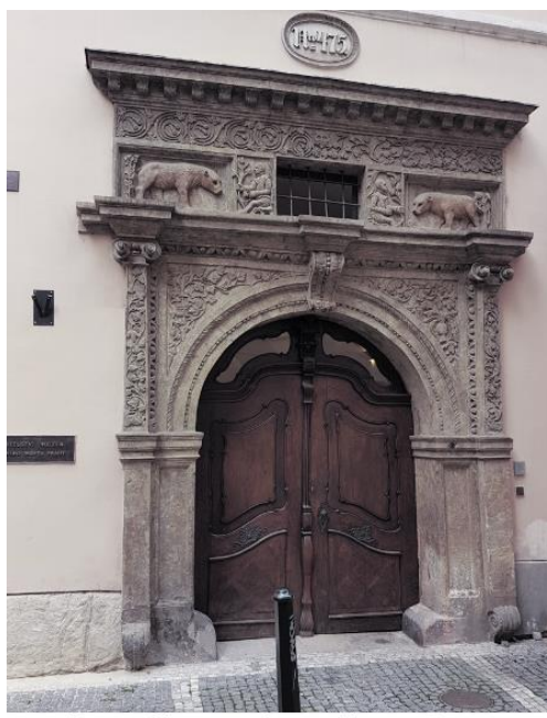
Prag - Haus zu den goldenen Bären