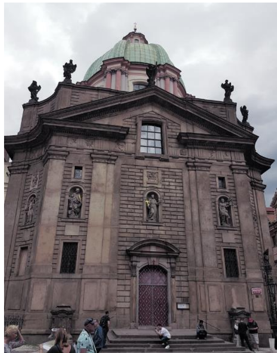
Prag - Kreuzherrenkirche