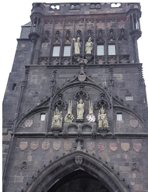
Prag - Altstädter Brückenturm