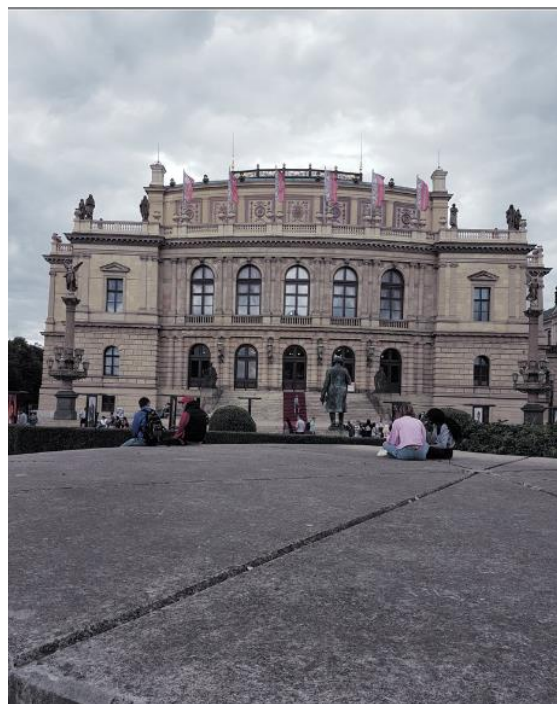
Prag - Rudolfinum