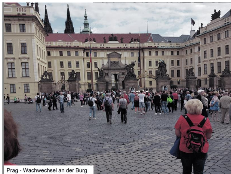
Prag - Wachwechsel an der Burg