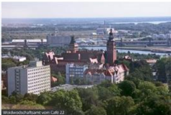
Woldawodschaltzamt vom Café 22