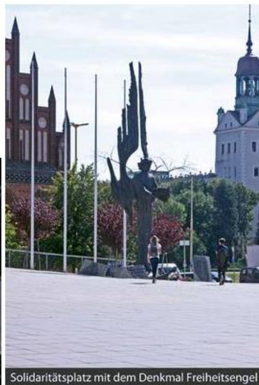
Solidaritätsplatz mit dem Denkmal Freiheitsengel