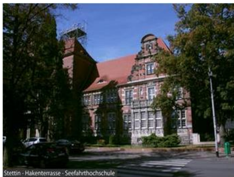
Stettin - Hakenterrasse - Seefahrtshochschule

Im Jahr 1873 wurde die Stettiner Festung abgerissen, weil sie die Entwicklung der Stadt behinderte. 1901 fasste man den Beschluss, das Gelände des Fort Leopold mit monumentalen Gebäuden zu bebauen. Um das besondere Engagement des damaligen Bürgermeisters Haken zu würdigen, wurde das Gebiet Hakenterrasse genannt. Drei Gebäude wurden errichtet: Die heutige Seefahrtshochschule, das Stadtmuseum und das Westpommersche Woivodschaftsamt (von Süden nach Norden). Davor befindet sich eine monumentale Treppenanlage aus Sandsteinblöcken. In der Mitte eine Plattform mit einer großen Springbrunnenanlage, an deren Seiten sich die Treppenaufgänge mit stilisierten Leuchttürmen als Lampenträger befinden. Oben als seitliche Abschlüsse zwei Pavillons.