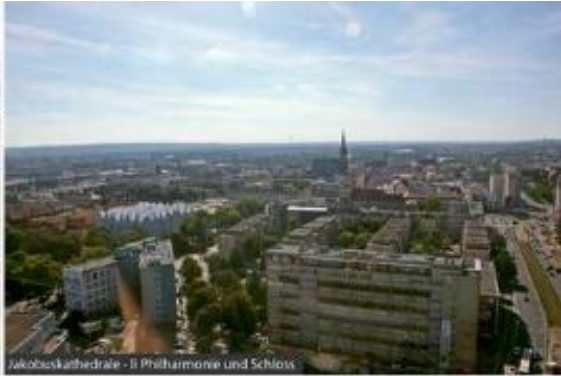
Jakobskathedrale - li Philharmonie und Schloss