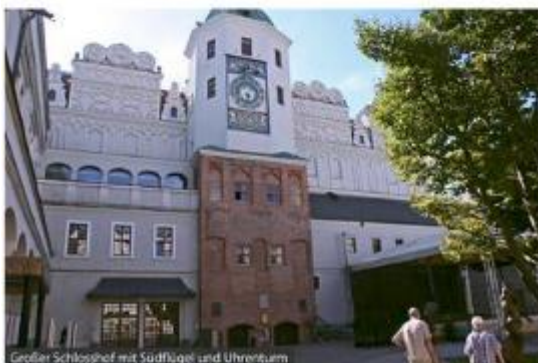
Großer Schlosshof mit Südfügel und Uhrenturm