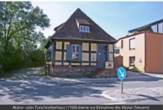
Akzise- oder Torschreiberhaus (1768) diente zur Einnahme der Akzise (Steuer)