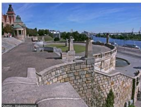
Stettin - Hakenterrasse