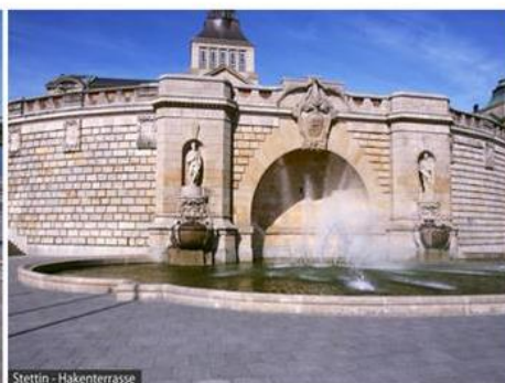
Stettin - Hakenterrasse