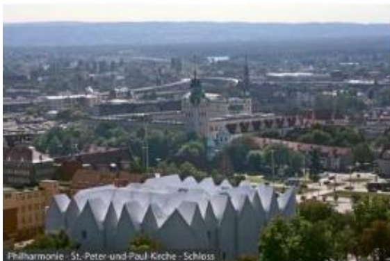
Philharmonie - St. Peter-und-Paul Kirche - Schloss