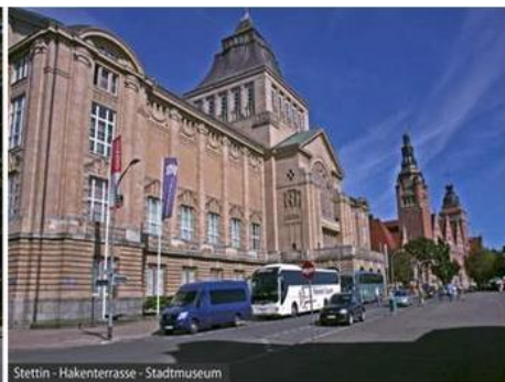
Stettin - Hakenterrasse - Stadtmuseum