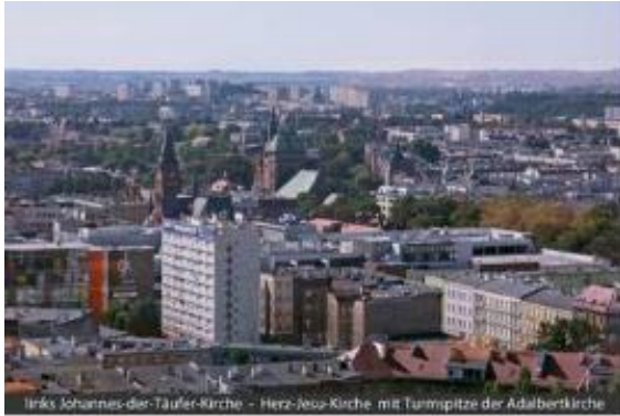
links Johannes-der-Täufer-Kirche - Herz-Jesus-Kirche mit Turmspitze der Adalbertkirche